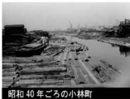
昭和40年ごろの小林町

このあたりは、大正6年ごろに西区の西道頓堀・西長堀等から集団移転してきた木材業者によって、西日本有数の木材市場となりました。この木材市場の中心であった木津川と尻無川を結ぶ大運河「大正運河」は、なんと、今の昭和山の下を通過していました！