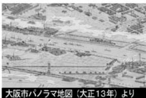
大阪市パノラマ地図（大正13年）より

このあたりには、明和8年（1771年）に検地を受けた平尾新田が広がっていました。昭和30年代までネギやスイカが有名でした。