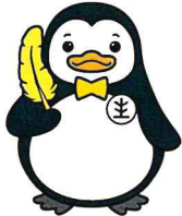
更生ペンギンの 「ホゴちゃん」