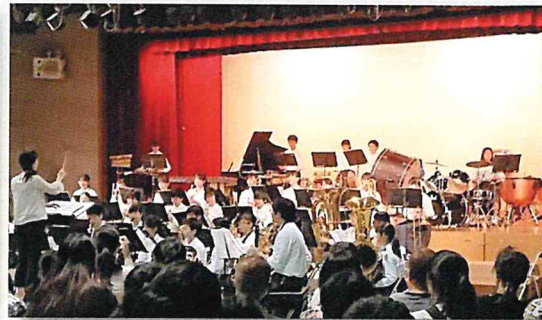
我孫子中学校吹奏楽部