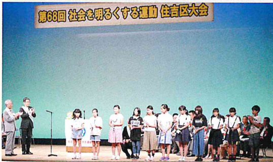
小学校標語コンクール表彰式（平成30年7月11日）