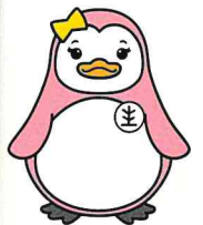
更生ペンギンの 「サラちゃん」