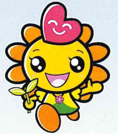
マスコットキャラクター 「アカルイーネ」