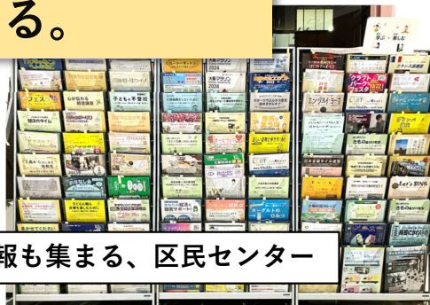
情報も集まる、区民センター

区民センターで実施されている教室、サークル情報や、 大阪市のイベント情報など、たくさんのチラシが定期的に入れ替わります。 この中から、あなたの「やってみたい」が見つかるかもしれません。 チラシに書かれた連絡先へ、まずはお気軽にご連絡ください♪