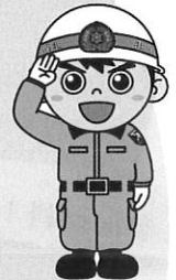
大阪市北消防署 びんちゃん