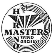
平野マスターズ 吹奏楽団

大阪音楽大学卒業。在学中よりオペラ指揮者として多くの公演を指揮。2001年イタリアに留学。2013年には年間オペラ公演回数が日本人第1位になるなどオペラ指揮者としての地位を確立。管弦楽では京都フィル、大阪響、オペラハウス管、京都市響、関西フィル、名古屋フィル、セントラル愛知響等を客演。さらに Osaka Shion Wind Orchestra、シエナ・ウィンド・オーケストラ等の吹奏楽団との関係も深く、その分野でも注目を集めている。近年はミュージカルにも活動の場を広げ、1999年の「ラ・カージュ・オ・フォル」を皮切りに、「マイ・フェアレディ」、「レ・ミゼラブル」、「キャバレー」等のロングラン公演を成功させライブCD及びDVDを発売。また、岩崎宏美や、夏川りみ、佐々木秀実、といった実力派シンガーとの共演も多く、コンサートでの軽妙なトークも話題となっている。また「浪速のモーツァルト：キダ・タロー」の作品の編曲も手掛け、キダ・タローとのコンサートも話題となっている。その活動の幅は指揮活動だけにとどまらず、オペラ演出、企画構成、さらには作曲、編曲、作詞も手掛け、マルチな才能を発揮。2011年には「岐阜 3000 人の第九」を成功に導くなど、多方面で大きな役割を担っている。2014年には、自身の企画により「ベートーヴェン 振るマラソン！」と題して、一日でベートーヴェンの全交響曲を一人で指揮。そのギネス級の活動には大きな話題となった。2011年東日本大震災を受け、毎年チャリティコンサートを開催。9回の演奏会で5400万円を超える義援金を届けた。クラシック音楽にとらわれない幅広いジャンル、年間100公演近くに及ぶ実績と、繊細且つダイナミックな指揮は、多くのファンを魅了し続けている。現在、春日井市第九演奏会音楽監督、関西音楽人のちから『集』代表、平野マスターズ吹奏楽団音楽監督。