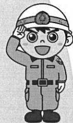
大阪市北消防署 びんちゃん