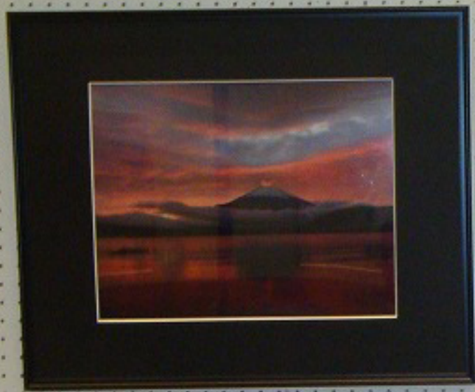
3 麓に昇って 2011年10月