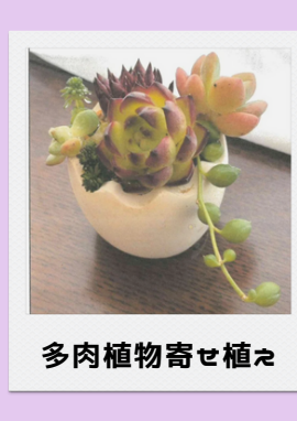
多肉植物寄せ植え